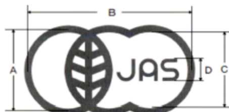
図：有機JASマークの様式

認証輸入業者から有機JASマーク貼付の受託にあたり、まず、JASマーク貼付の担当責任者を選任